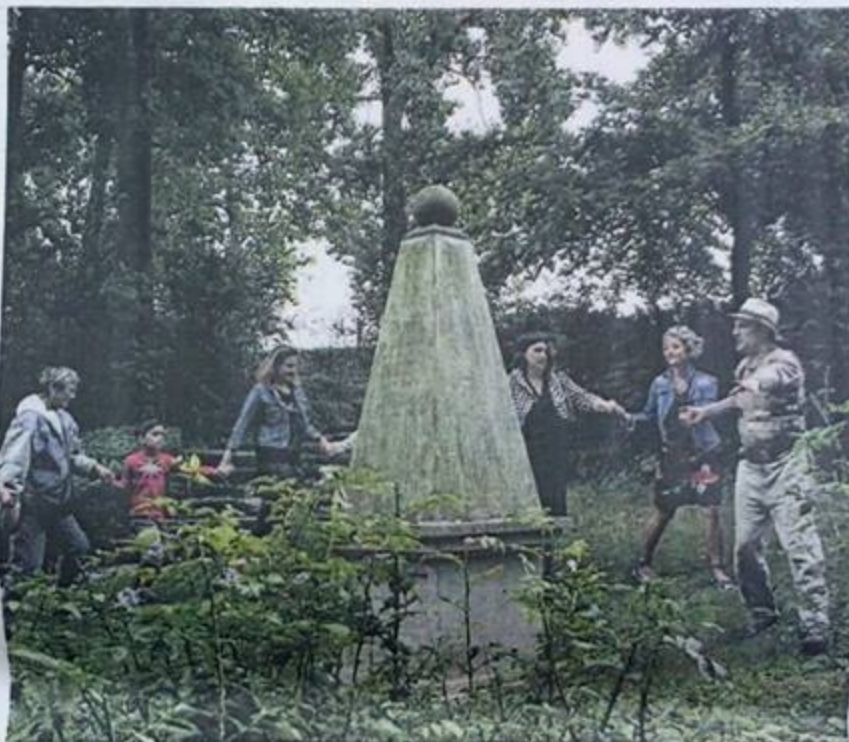
Les visites « Dé-Calais » permettent de découvrir les monuments de la ville de manière inattendue. Et de faire participer le public.

Le chemin éloigne le groupe de touristes de ces deux majestueuses statues de 600kg de bronze et le guide devant Lady Hamilton. Moment pro-